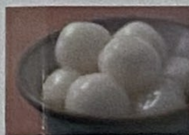
お団子手作りセット