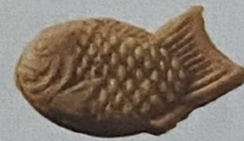
たい焼き屋さんお試しセット 送料無料1000円