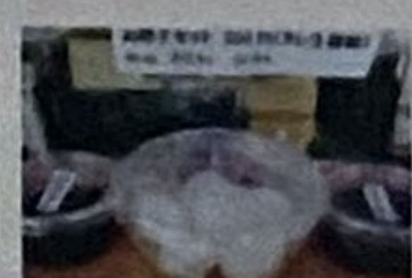
こしあんのみたらしと お団子3点セット

工場前の狭いスペースではありますが 毎週木曜日（10：00～16：00）と 最終土曜日（10：00～18：00）は 工場直売をしております。 各種あんこ・もなかと直売でしか販売していない 自家製わらび餅、お団子セットなどもございます。