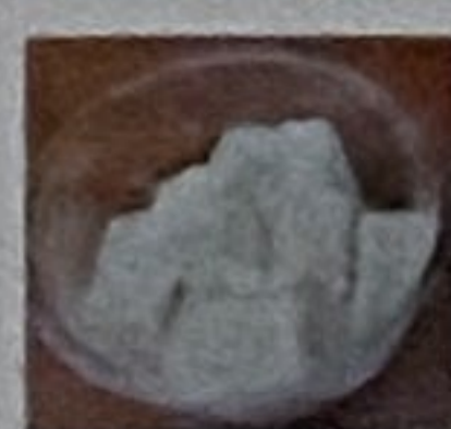
人気の 自家製わらび餅