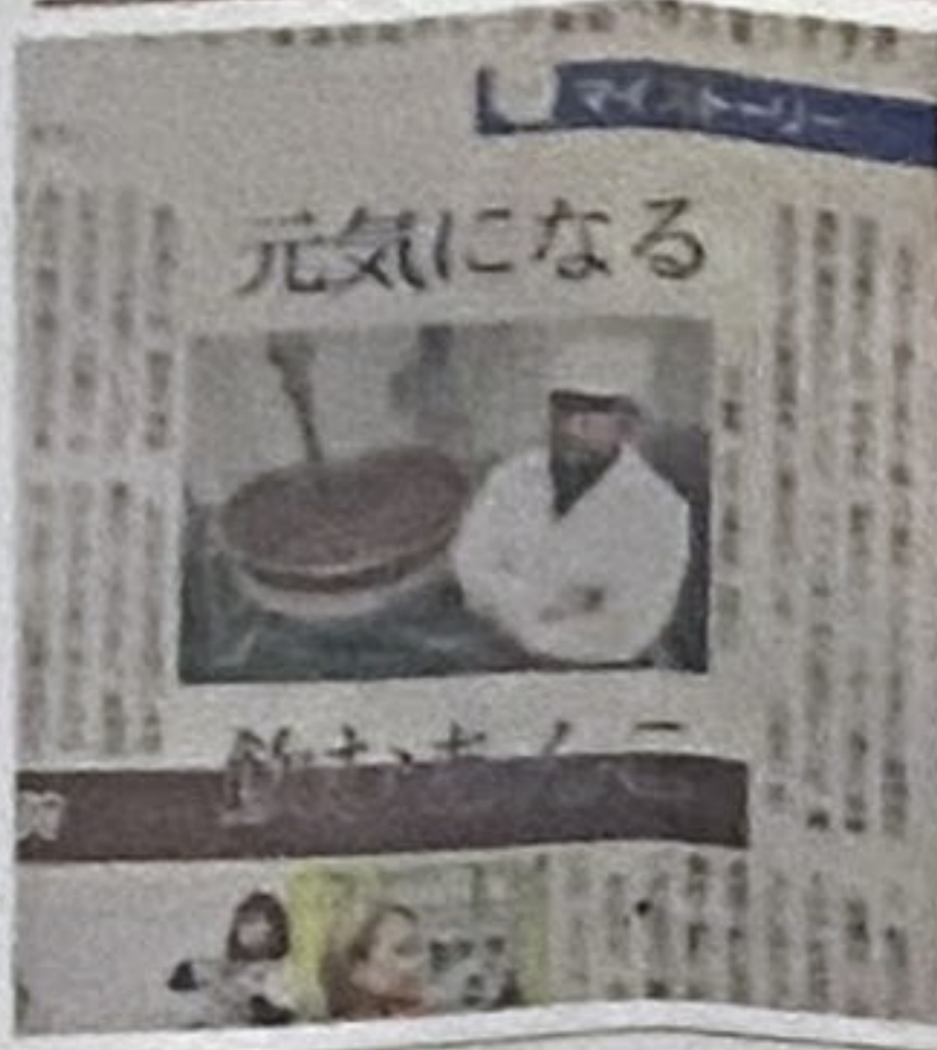
「サンデー東京けいさい面」に掲載していただきました。

東京都板橋区幸町であんこ屋をはじめ半世紀！ 只今、二代目が心を込めて作っております。 大手和菓子店などの卸がメインのキノアン（木下製館）ですが 小売りにも力を入れております。 板橋のいっぴんに選んでいただいております「東京もなか」をはじめ 「ティベアもなかRUUT」あんこは500gからございます。 楽天市場「あんこ職人キノアン」でも販売しておりますのでご覧ください。